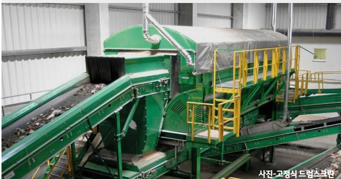
사진- 고정식 드럼스크린